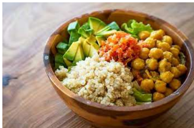
スーパーフードのサラダボウル