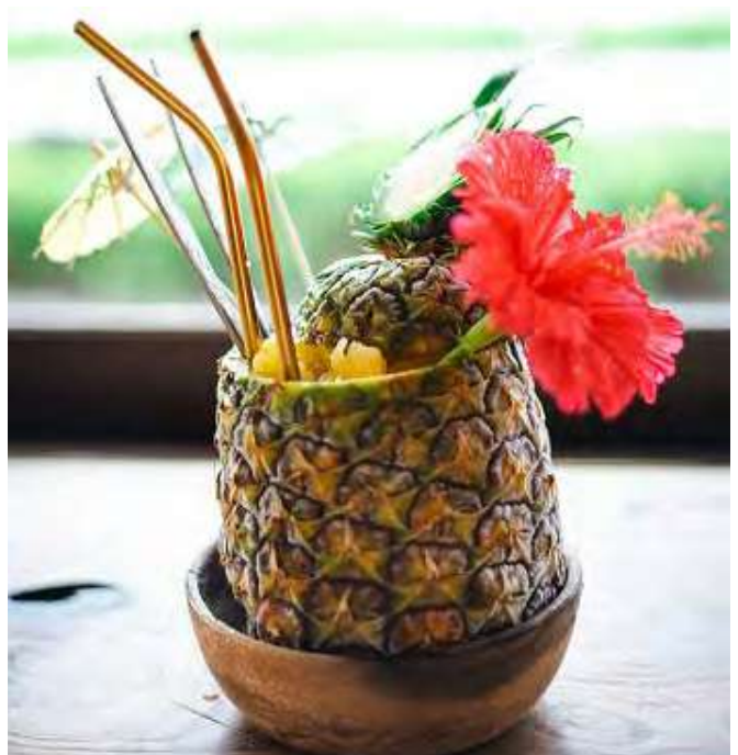
丸ごとマリブパイ