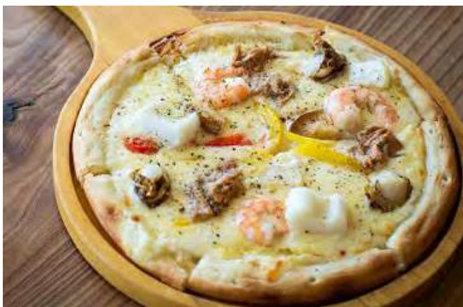
シーフードピッツァ