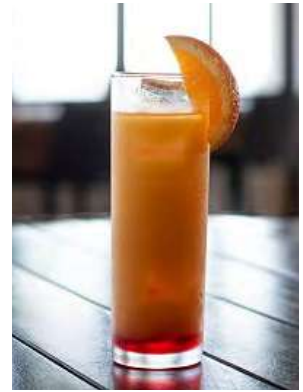
八重山サンセット