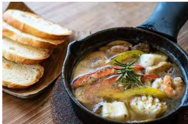
海老とイカのアヒージョ