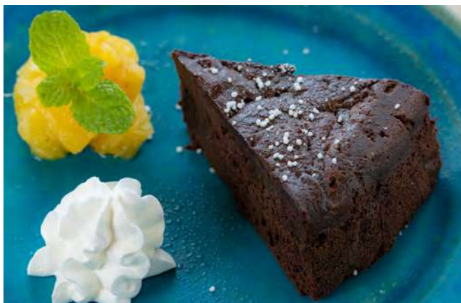
小浜島産黒糖入りガトーショコラ