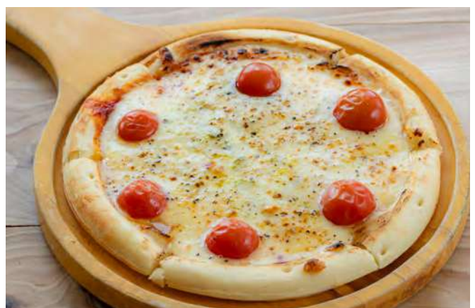
トマトとバジルのピッツァ