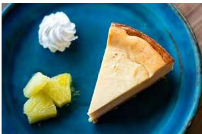
キビ砂糖のバイクドチーズケーキ