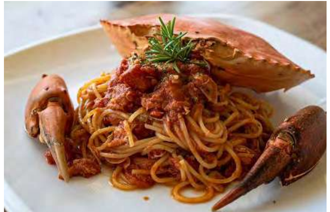
ワタリガニのトマトクリームパスタ