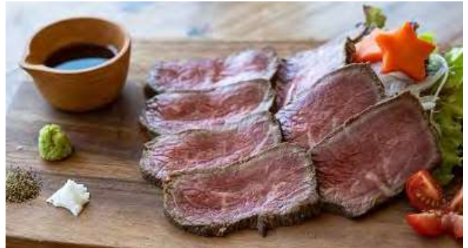
国産牛のローストビーフ