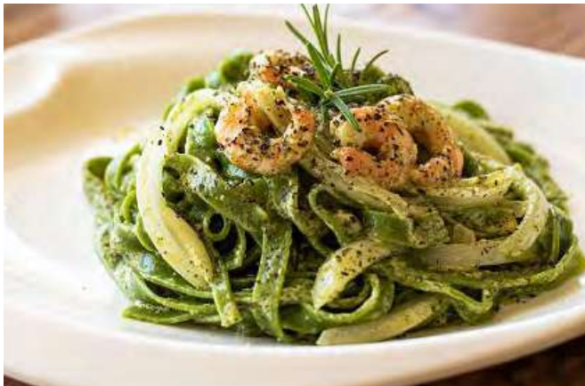
海老とバジルのグリーンフェットチーネ