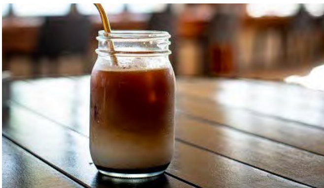
小浜島黒糖カフェオレ