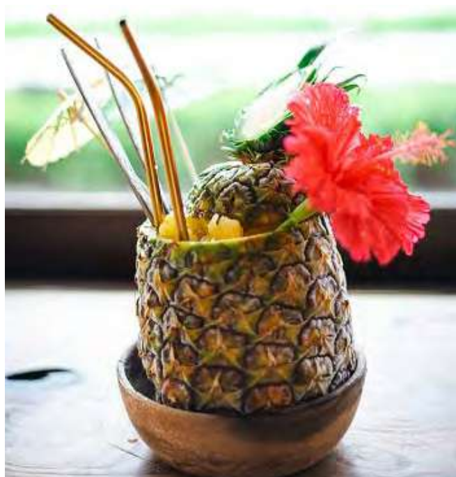
丸ごとパインジュース