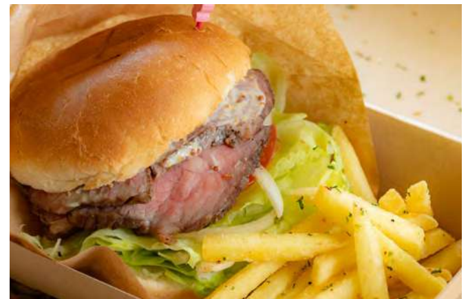
国産牛のローストビーフバーガー

🕒 10:00 ~ 16:00 Available only for daytime 🇯🇵 国産牛のローストビーフバーガー 容器代込 ¥1600 Roast Beef Burger