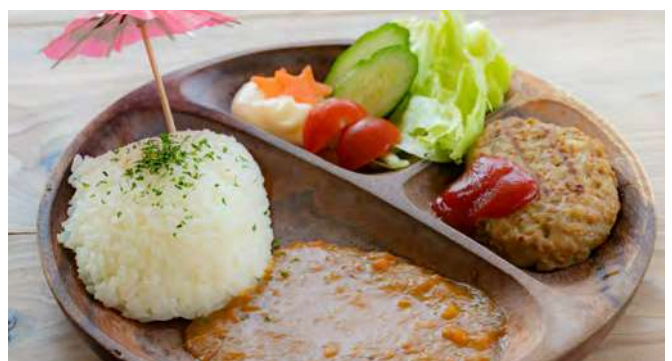
海カフェお子様プレート