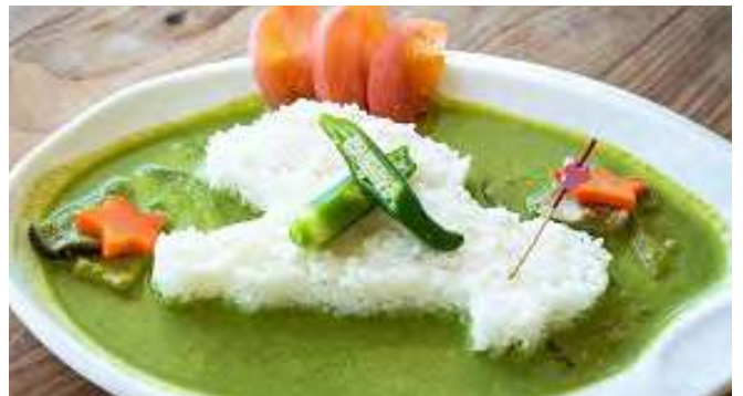
小浜島エメラルドグリーンカレー