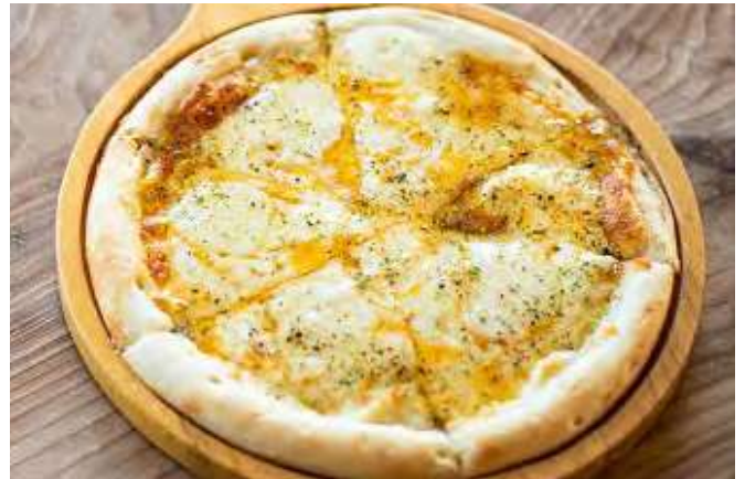
3種のチーズピッツァ