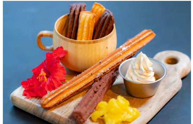
チュロス&プリーツドーナツ

デザートのご注文で好きなドリンクから ¥200引き ブルーシールアイスクリームの場合好きなドリンクから ¥100引き