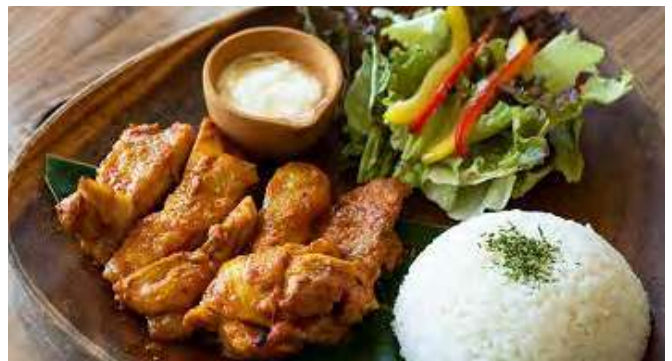
タンドリーチキンプレート