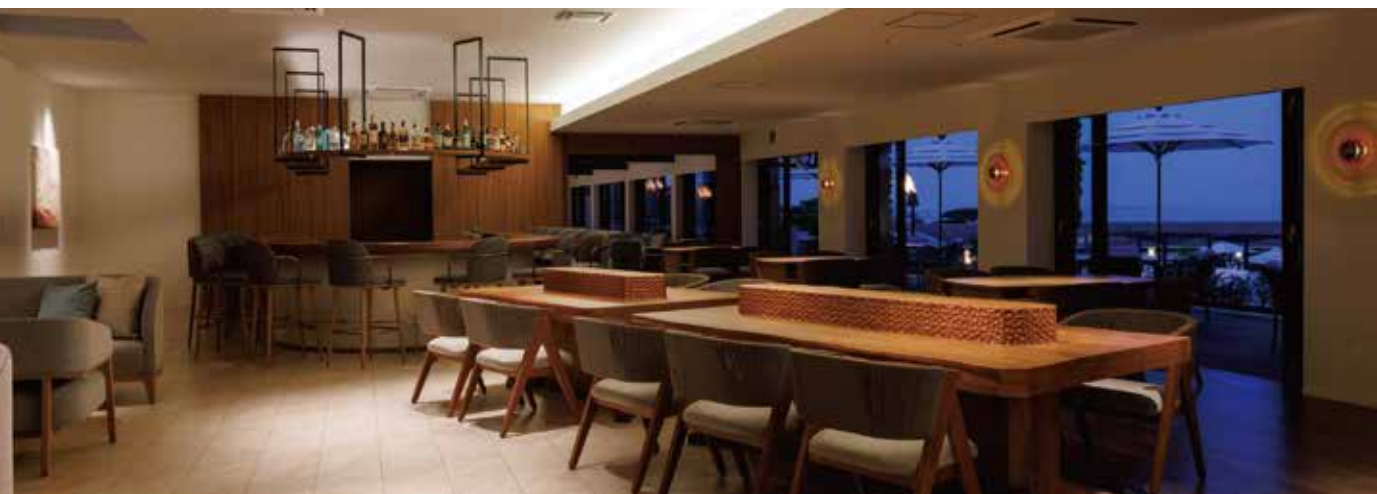
The Lounge & Bar ザ・ラウンジ&バー