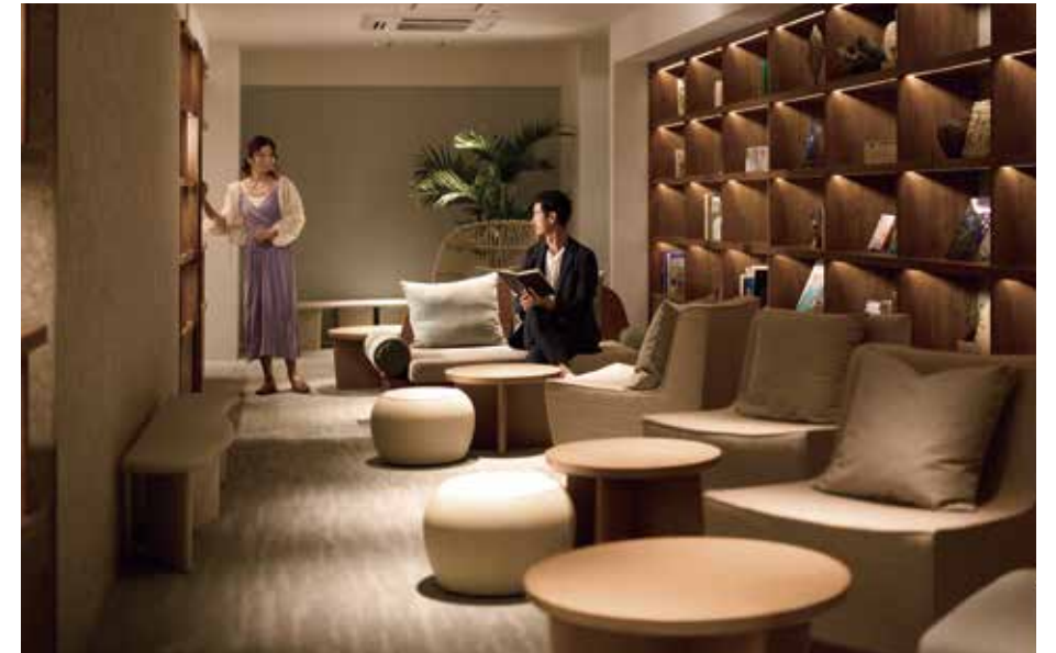
Library Lounge ライブラリーラウンジ