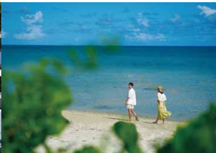
Haimurubushi Beach はいむるぶしビーチ