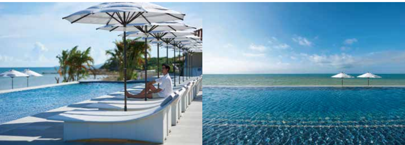
Main Pool メインプール