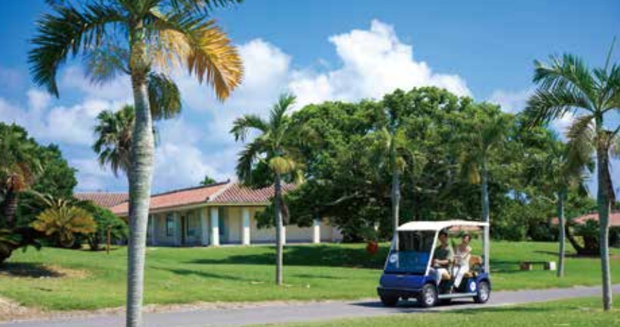
Rental Karts レンタルカート