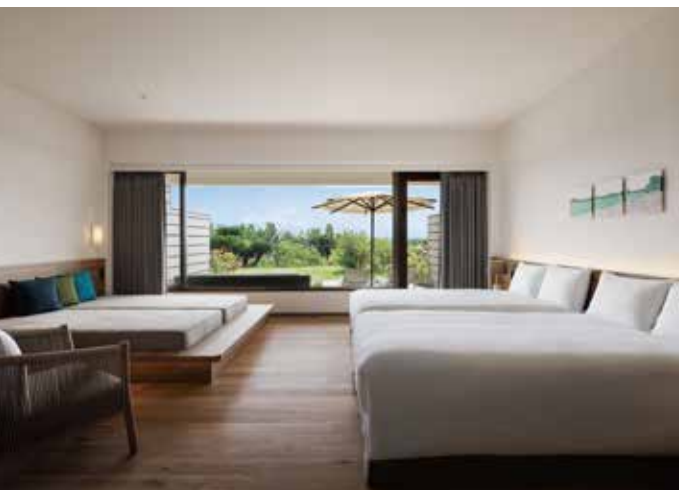
Garden Terrace Premium ガーデンテラス・プレミアム