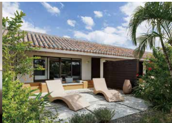
Garden Terrace Deluxe ガーデンテラス・デラックス