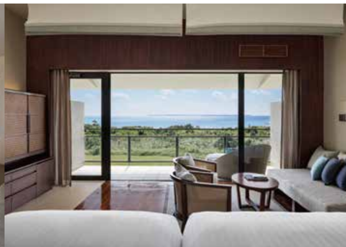
Premier Ocean View Luxury プレミアオーシャンビュー・ラグジュアリー