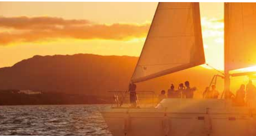
Sunset Cruise サンセットクルーズ