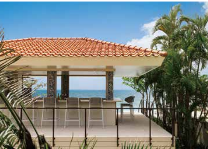
The Beach Café ザ・ビーチカフェ