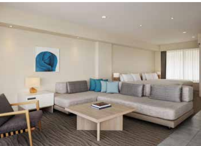
Ocean View Suite オーシャンビュー・スイート

The vast ocean, swaying greenery, and stars twinkling in the night sky. Every guestroom at Haimurubushi is designed in harmony with nature. Whether it's a quiet moment drifting off on the terrace breeze, reading a book surrounded by lush greenery, or enjoying an active day in island time, every moment becomes a soothing experience. Even a morning cup of coffee or an afternoon read turns into something irreplaceable here. With a variety of room types and calming interiors, we offer a stay that gently embraces each guest.