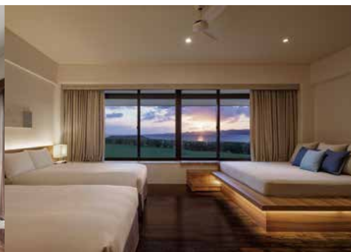
Ocean View Premium オーシャンビュー・プレミアム