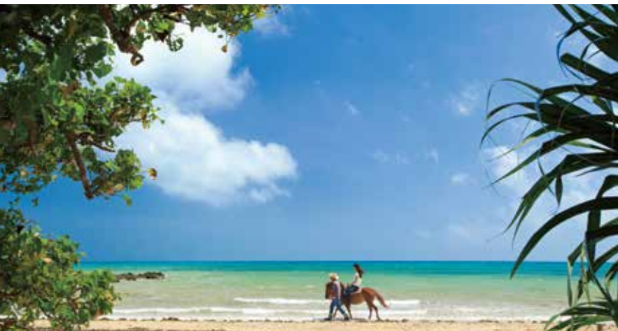
Horseback Riding 乗馬