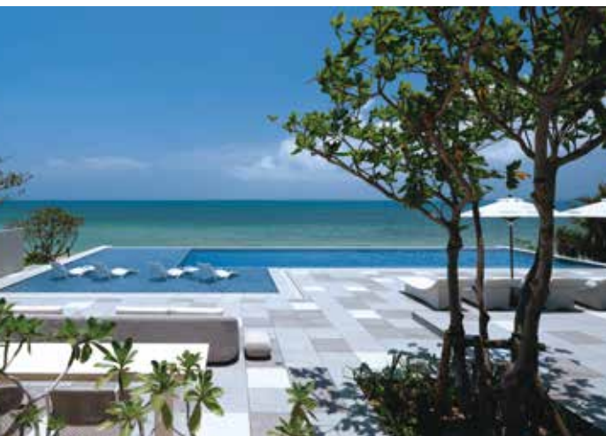
Quiet Pool クワイエットプール