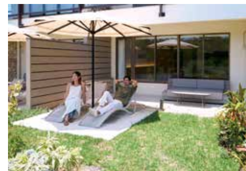
Garden Terrace Premium ガーデンテラス・プレミアム