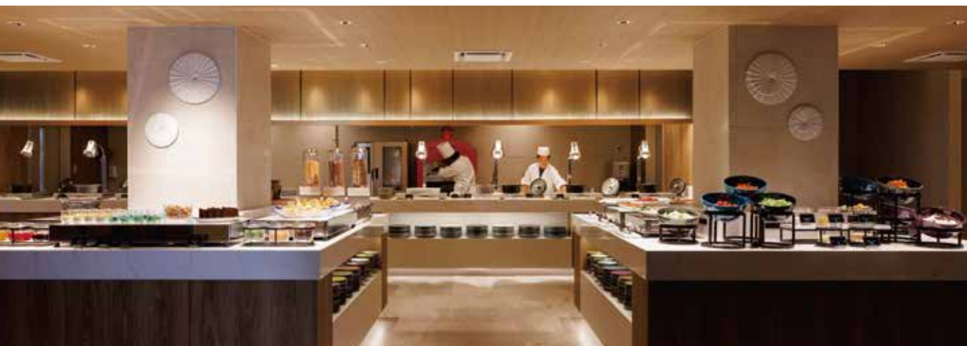
The Buffet ザ・ビュッフェ