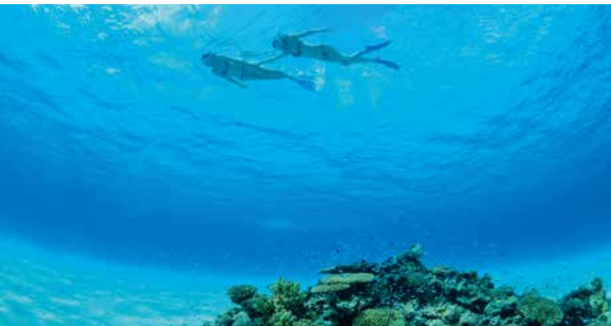
Snorkeling & Diving スノーケリング&ダイビング