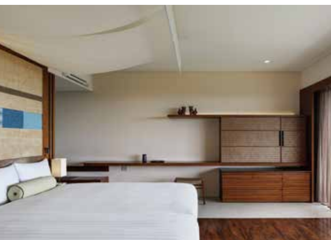
Ocean View Luxury オーシャンビュー・ラグジュアリー