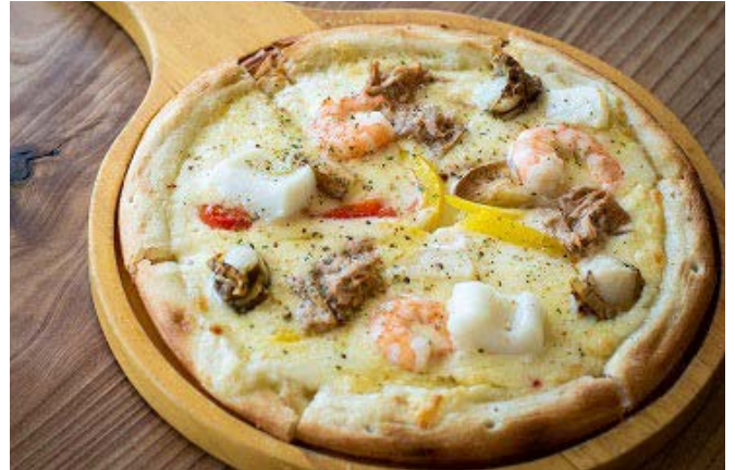
シーフードピッツァ