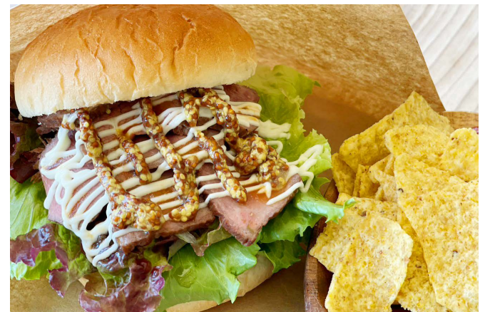
国産牛のローストビーフバーガー