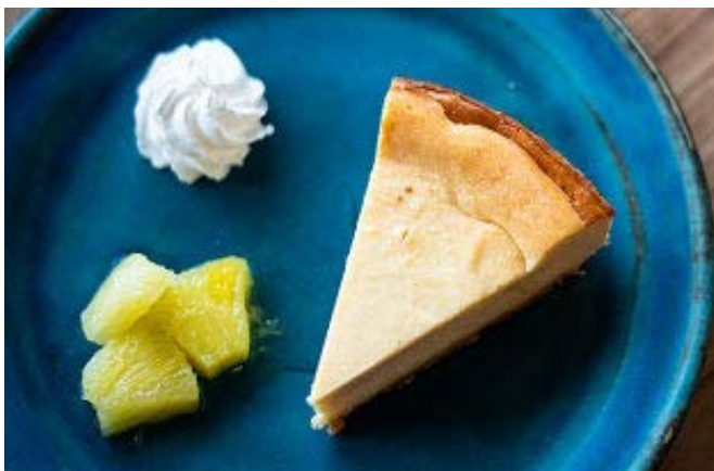
キビ砂糖のバイクドチーズケーキ