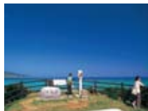
ちゅらさん展望台