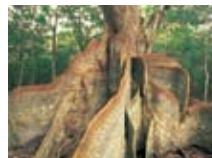
西表島(サキシマスオウノキ)