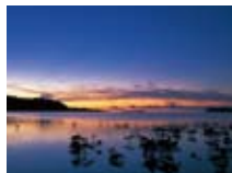
アカヤのマングローブ