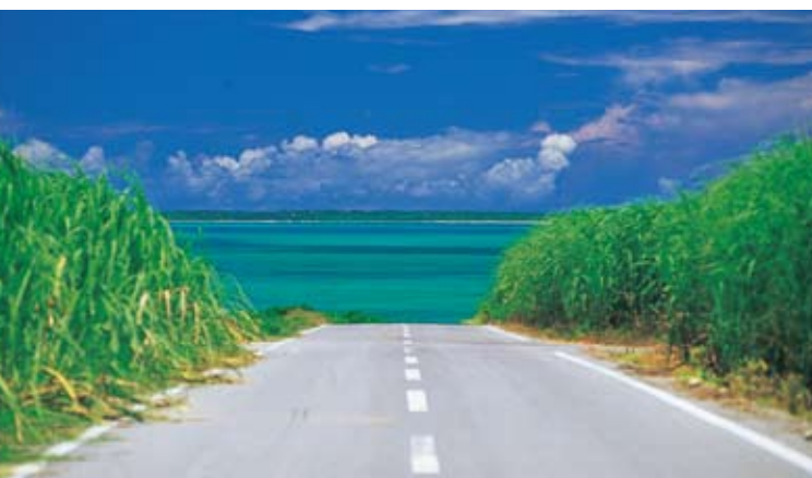
小浜島から竹富島を望む